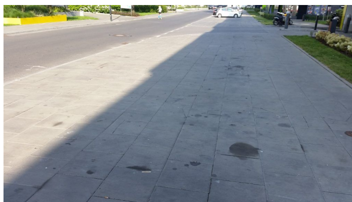
Fot. Betonowa pustynia na ul. Jędrusik.